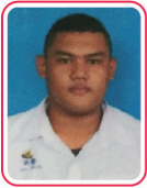
จกมล เงินทรัพย์ คณะวิศวกรรมศาสตร์ มหาวิทยาลัยศิลปากร